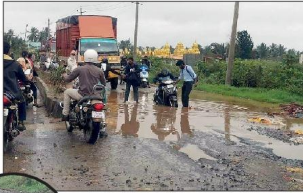
ಅತ್ತಿಬೆಲೆ-ಆನೇಕಲ್ ರಸ್ತೆಯ ಟಿವಿಎಸ್ ಕ್ರಾಸ್ ಸಮೀಪ ಅವ್ಯವಸ್ಥೆ.

ತಮಿಳುನಾಡಿಗೆ ಸಂಪರ್ಕ ಕಲ್ಪಿಸುವ ಈ ರಸ್ತೆಯಲ್ಲಿ ಪ್ರತಿನಿತ್ಯ ಸರಕು ಸಾಗಣೆ ಲಾರಿಗಳು, ಟಿಪ್ಪರ್ ಲಾರಿಗಳು ಸೇರಿ ಸಾವಿರಾರು ವಾಹನಗಳು ಸಂಚರಿಸುತ್ತವೆ. ಕಳೆದ ವಾರ ಸುರಿದ ಮಳೆಗೆ ಪರಿಸ್ಥಿತಿ ಮತ್ತಷ್ಟು ಬಿಗಡಾಯಿಸಿದ್ದು ಗುಂಡಿಗಳಲ್ಲಿ ನೀರು ತುಂಬಿ ಕೊಂಡು, ರಸ್ತೆ ಯಾವುದು? ಗುಂಡಿ ಯಾವುದು ಎಂಬುದೇ ಗೊತ್ತಾಗದ ಪರಿಸ್ಥಿತಿ ನಿರ್ಮಾಣವಾಗಿದೆ. ನಿರ್ವಹಣೆ ಹೊಣೆ