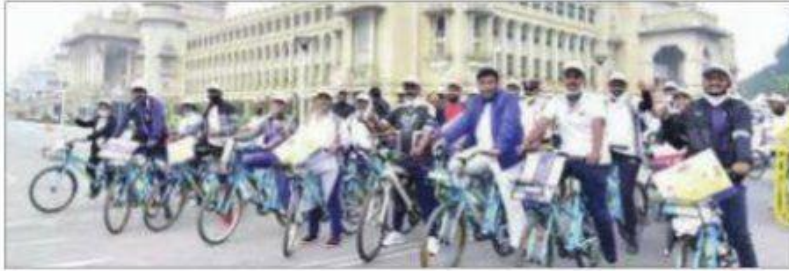
ವಿಧಾನಸೌಧದ ಬಳಿ ಜಿಬಿಎಂಪಿ ವತಿಯಿಂದ ಛಾತುವಾರ ಜರುಗಿದ ಸೈಕ್ಲೋಥಾನ್ ಕಾರ್ಯಕ್ರಮದಲ್ಲಿ ಸೈಕಲ್‌ಸವಾರರು ಬಹಳ ಉತ್ಸಾಹದಿಂದ ಪಾಲ್ಗೊಂಡಿದ್ದರು.

ಇದೇ ವೇಳೆ ಕೊರೊನಾ ವಾರಿಯರ್ಸ್‌ ಆಗಿ ಕಾರ್ಯನಿರ್ವಹಿಸಿದ ವೈದ್ಯರು, ಸಂಚಾರಿ ವಿಭಾಗದ ಪೊಲೀಸರು ಹಾಗೂ ಮಾರ್ಷಲ್ ಗಳನ್ನು ಗುರುತಿಸಿ 2,000 ರೂ. ಪ್ರೋತ್ಸಾಹ ಗೌರವಧನ, ಸ್ಮರಣಿಕೆ ನೀಡಿ ಗೌರವಿಸಲಾಯಿತು. ಇದಕ್ಕೂ ಮುನ್ನ ನಡೆದ ಸೈಕ್ಲೋಥಾನ್ ಹಡ್ಜನ್ ವೃತ್ತದಿಂದ ಚಿನ್ನಸ್ವಾಮಿ ಕ್ರೀಡಾಂಗಣದ ಕಸ್ತೂರಬಾ ರಸ್ತೆ(ಕ್ರೀನ್ಸ್ ರಸ್ತೆ) ಮೂಲಕ ಜಿ.ಪಿ.ಓ ವೃತ್ತ, ರಾಜಭವನ ರಸ್ತೆ, ಚಾಲುಕ್ಯ ವೃತ್ತ, ಡಾ. ಬಿ.ಆರ್.ಅಂಬೇಡ್ಕರ್ ವೀಧಿ (ಎಂ.ಎಸ್. ಕಟ್ಟಡ ಮಾರ್ಗವಾಗಿ), ಕೆ.ಆರ್.ವೃತ್ತ, ನೃಪತುಂಗ ರಸ್ತೆ ಮಾರ್ಗವಾಗಿ ಮತ್ತೆ ಹಡ್ಜನ್ ವೃತ್ತ ತಲುಪುವ ಮೂಲಕ ಸೈಕ್ಲೋಥಾನ್ ಪೂರ್ಣಗೊಂಡಿತು.